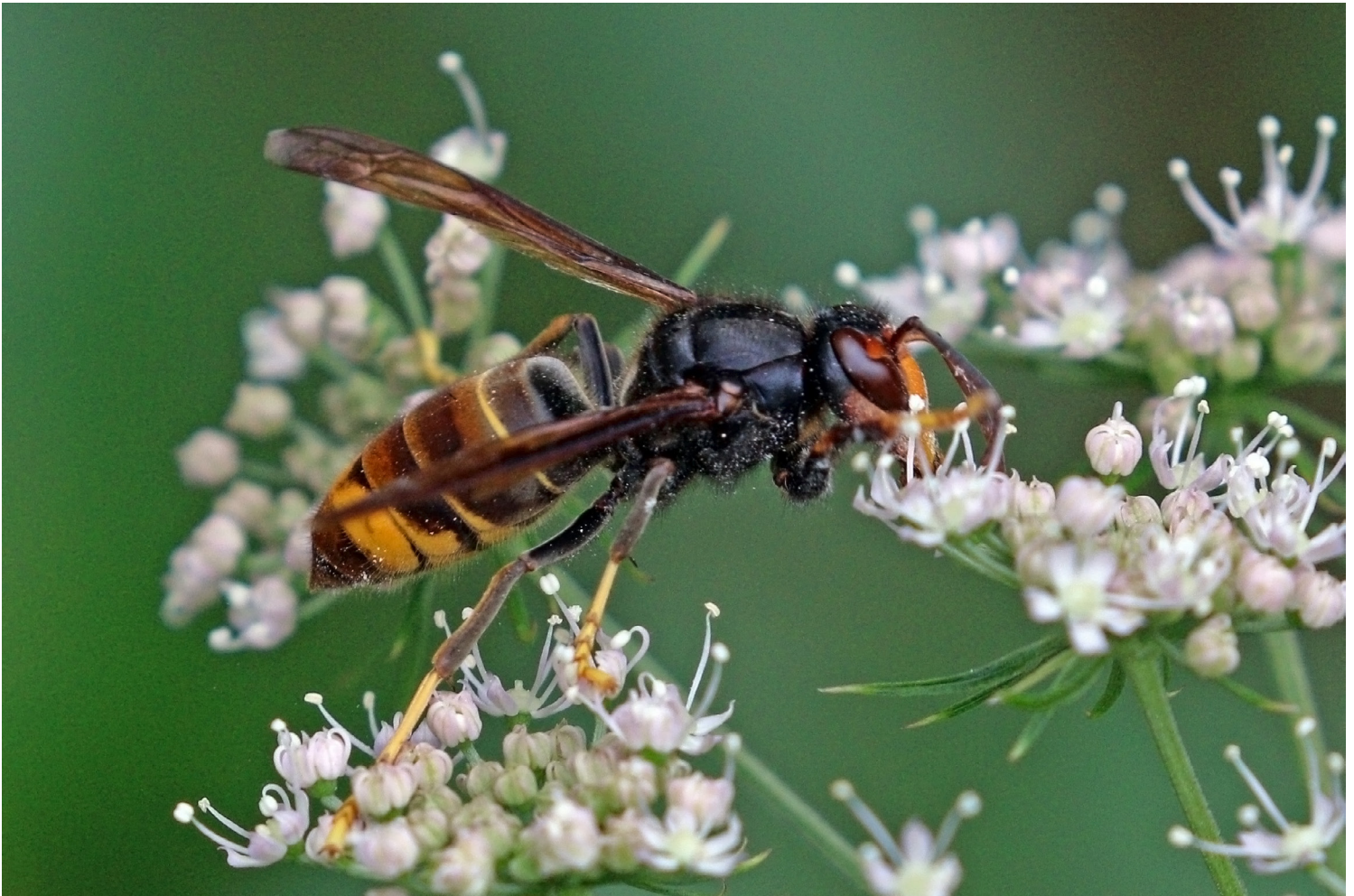
Aziatische hoornaar ( Vespa velutina )