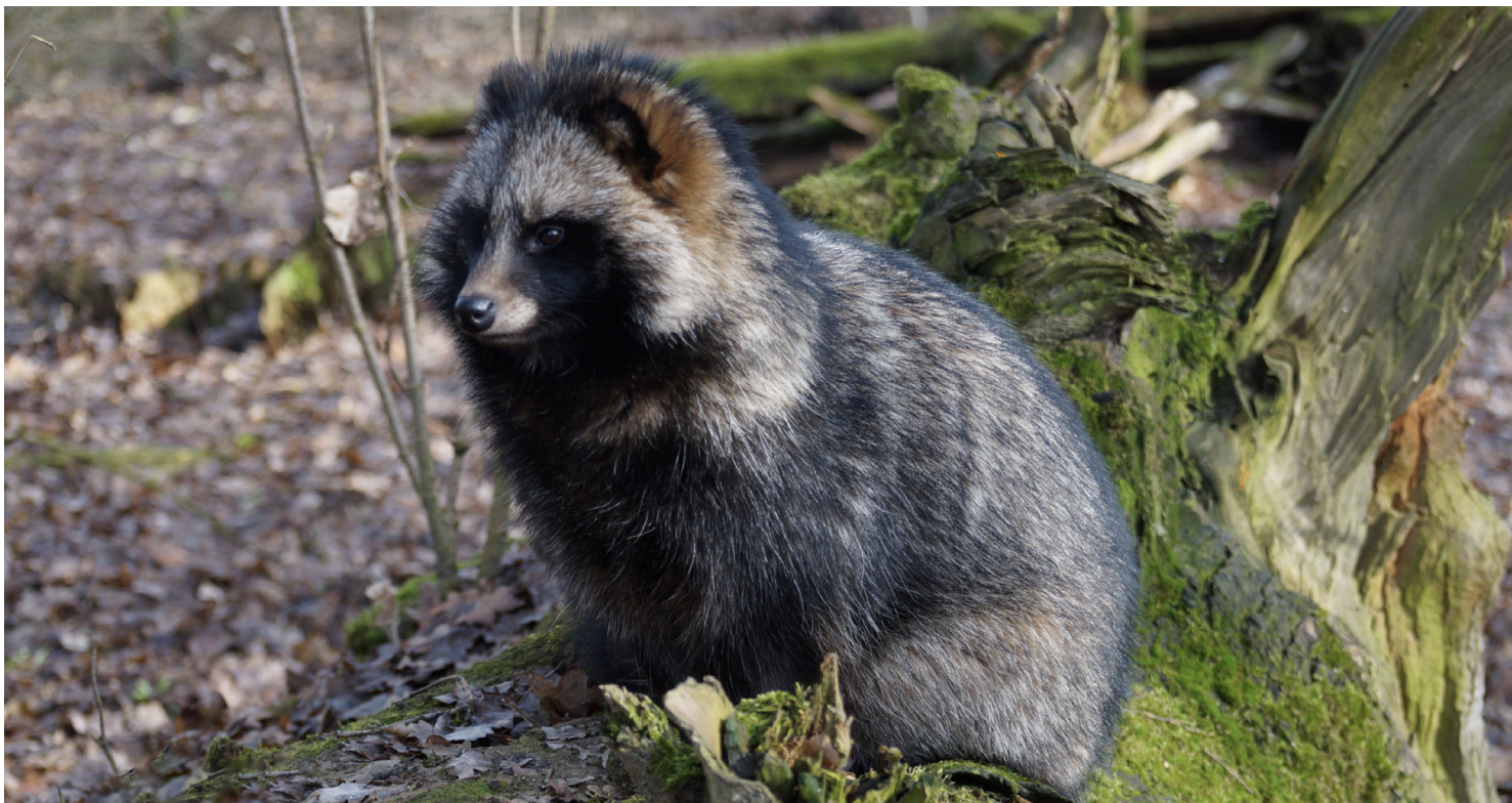
Wasbeerhond ( Nyctereutes procyonoides )

Wanneer een invasieve exoot in of nabij een Natura 2000-gebied een bedreiging vormt voor de instandhoudingsdoelstellingen, en de grondgebruiker hiervan op de hoogte is of zou moeten zijn, kan de mogelijkheid onderzocht worden om op grond van de zorgplichtbepaling 1.11 van de Wnb handhavend op te treden. Ook heeft GS de mogelijkheid om op grond van artikel 2.6 van de Wnb handelingen te (laten) verrichten die nodig zijn, gelet op de instandhoudingsdoelstellingen voor een Natura 2000-gebied.