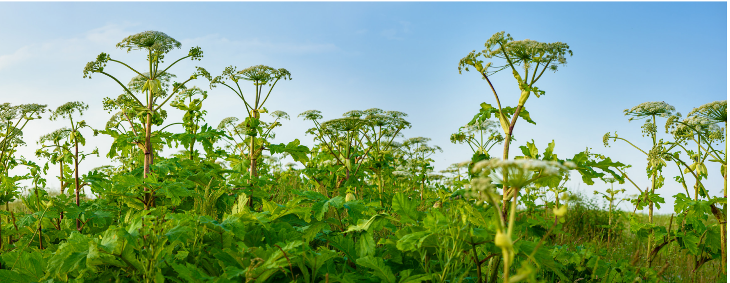
Reuzenberenklauw ( Heracleum mantegazzianum )