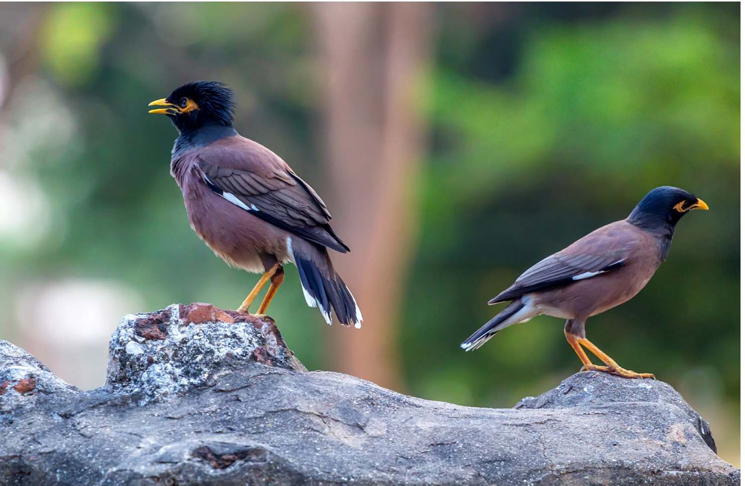
Treurmaina ( Acridotheres tristis )