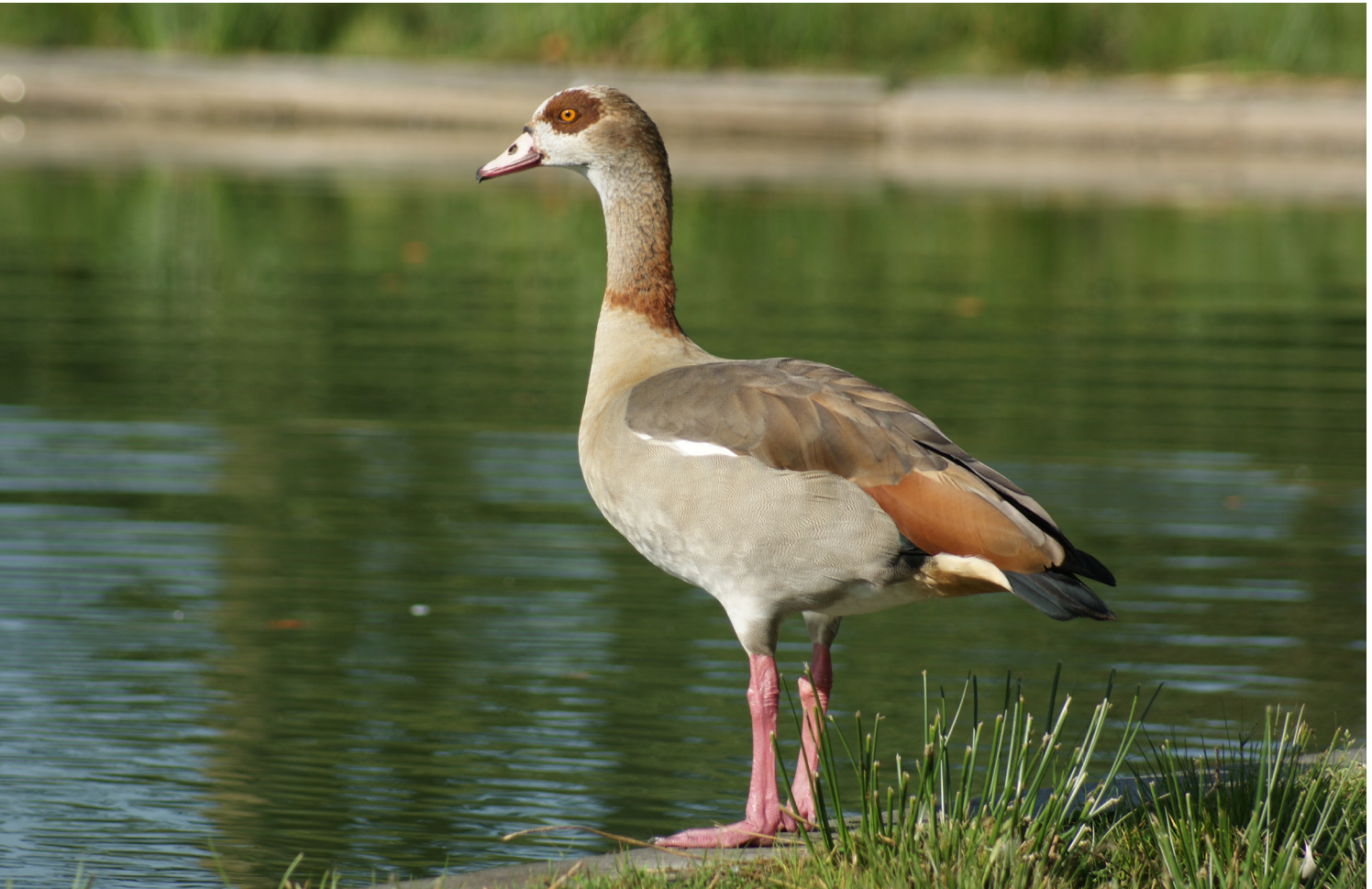
Nijlgans ( Alopochen aegyptiaca )