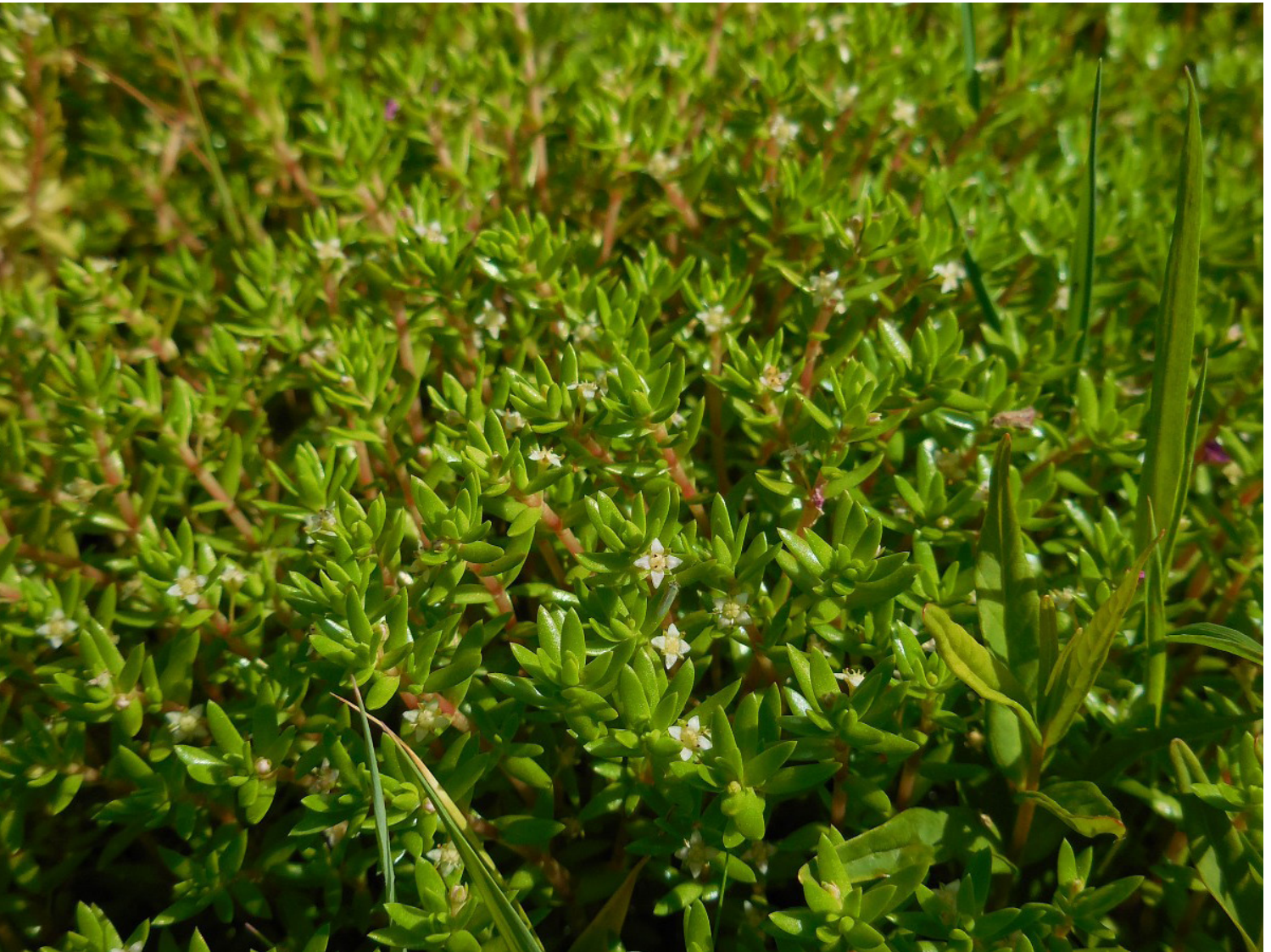
Watercrassula ( Crassula helmsii )