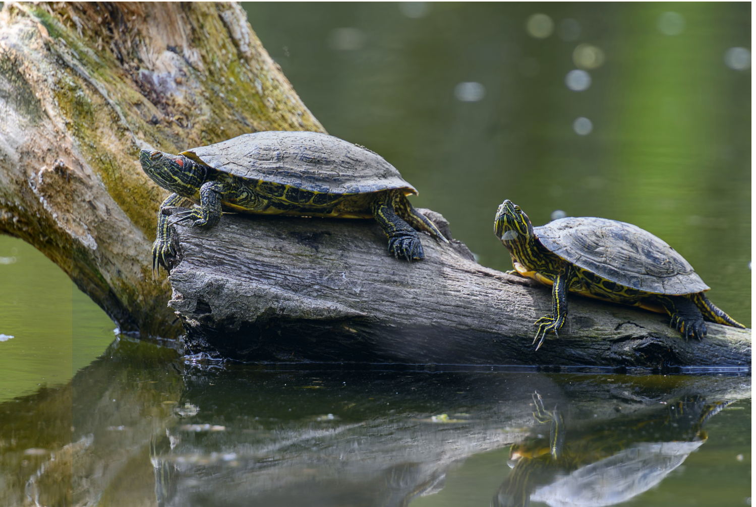
Lettersierschildpad ( Trachemys scripta )